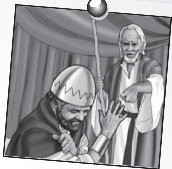
David 2 leçon 4

Dieu punit le mal mais il pardonne celui qui se repent.