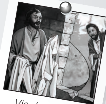
Vie de Christ 4 leçon 5

La pierre fut roulée, révélant un tombeau vide. Le corps de Jésus enveloppé dans les bandelettes ou linges avait disparu. Les gardes romains s'évanouirent à la vue des anges. Ces derniers annoncèrent que Jésus était vivant. Jésus est vraiment ressuscité et il vit pour toujours !