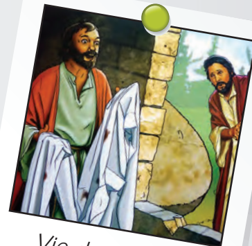
Vie de Christ 4 leçon 5

La pierre fut roulée, révélant un tombeau vide. Le corps de Jésus enveloppé dans les bandelettes ou linges avait disparu. Les gardes romains s'évanouirent à la vue des anges. Ces derniers annoncèrent que Jésus était vivant. Jésus est vraiment ressuscité et il vit pour toujours !