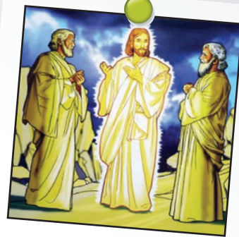
Vie de Christ 3 leçon 3

Placez une petite récompense dans la pièce et disposez des obstacles entre cet objet et le point de départ que vous aurez fixé. Définissez une personne qui sera la bonne voix. Bandez ensuite les yeux d'un enfant et recommandez-lui d'écouter la bonne voix pour atteindre son objectif. Les membres de la famille lui donneront tous des instructions, sans crier, mais un seul, la bonne voix, lui indiquera le chemin à suivre. Jésus est la bonne voix à laquelle tu dois obéir.