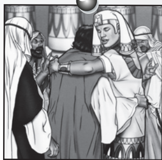
Joseph leçon 5

Révision des versets précédents Psaume 121.5, 145.9 et Jérémie 29.11