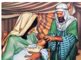
📖 Genèse 30.23-24

- « Je lui donnerai le nom de Joseph, dit-elle. Je sais que Dieu me donnera un deuxième fils ». Joseph signifie : « Il ajoutera ».