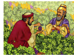
📖 1 Rois 21.2-3

- « Pourquoi es-tu de si mauvaise humeur et refuses-tu de manger ? »