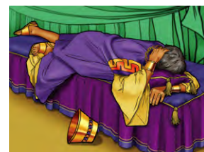
📖 1 Rois 21.5

Les enfants pourraient jouer cette scène et la suivante.