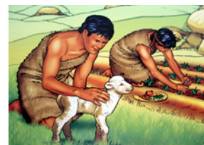
Placez Caïn (B-21) puis Abel (B-19) et les moutons (B-20).

Les enfants d'âge préscolaire pourraient jouer des bergers comme Abel et des fermiers comme Caïn.