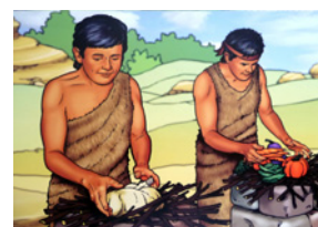
Placez l'autel d'Abel (B-23).

La Bible ne dit pas qu'Adam ait montré à ses enfants l'exemple d'offrir des offrandes à l'Eternel. Genèse 4.3 suggère qu'un moment précis avait été fixé pour apporter ces offrandes.