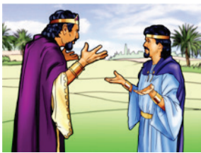
1 Samuel 19.4-6

Cette leçon s'adresse plutôt à des enfants convertis. Si des enfants du groupe ont besoin d'un rappel plus détaillé de l'Évangile, prévoyez un chant sur le sujet.