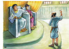
Drusille est la fille cadette d'Hérode Agrippa I.