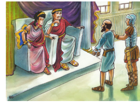
Hérode Agrippa II, fils d'Hérode Agrippa I, régnait au nord de la Palestine. Bérénice est une sœur de Drusille.

Paul était prêt et savait ce qu'il devait dire. C'est important que tu réfléchisses bien à ce que tu diras quand des occasions de témoignage se présenteront. Tu pourrais leur dire comment tu as « rencontré Jésus » et à quel point il a changé ta vie. C'était sans doute moins spectaculaire que ce qui est arrivé à Paul, mais l'important n'est pas là. Dis-leur que c'est formidable de vivre avec le Seigneur Jésus.